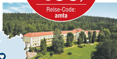
Beispiel Doppelzimmer Komfort