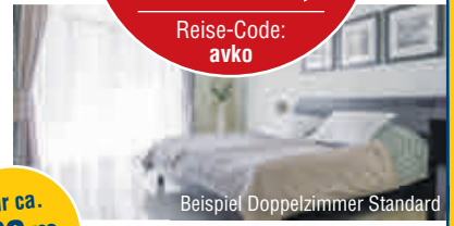
Beispiel Doppelzimmer Standard