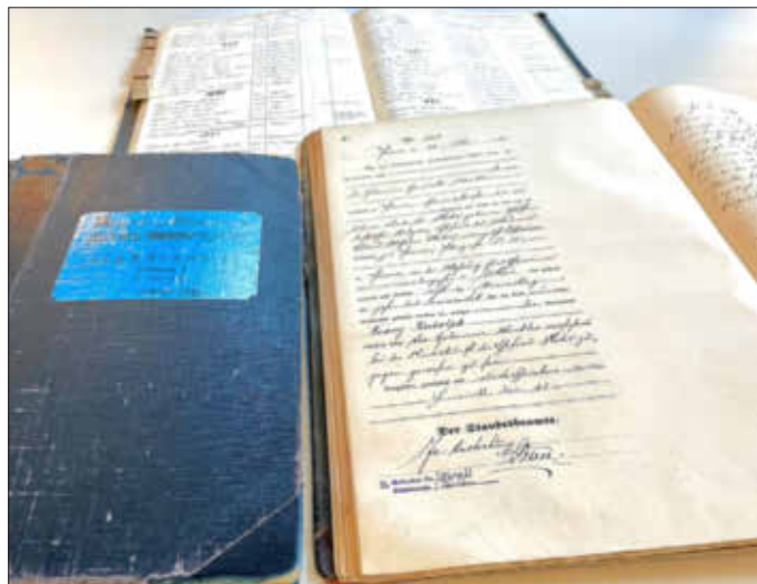
Landratsamt Pirna - Landkreis Sächsische Schweiz-Osterzgebirge

An diesem Beispiel zeigen sich einmal mehr die Bedeutung und die Wirksamkeit des Landesdigitalisierungsprogrammes für zahlreiche Einrichtungen in ganz Sachsen: Viel nachgefragte und für die historische Forschung bedeutsame Quellen können dank des Programms digitalisiert werden und stehen dann niederschwellig und weltweit für jeden online zur Verfügung.“