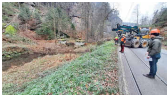
Mitarbeitende der Nationalpark- und Forstverwaltung von Sachsenforst und beauftragter Firmen bewegen gefällte Borkenkäferfichten über die Kirnitzsch zur Straße, um sie dort zu häckseln und anschließend abzutransportieren.

Die Nationalpark- und Forstverwaltung hatte die Maßnahme bewusst für die Zeit nach der Hauptsaison geplant. Für die Arbeiten musste die Kirnitzschtalstraße temporär gesperrt und jeden Tag von den Waldarbeitern gereinigt werden. Denn die Sperrung wurde auf ein tägliches Zeitfenster begrenzt, um Einschränkungen für Anwohnende und Gäste zu minimieren.