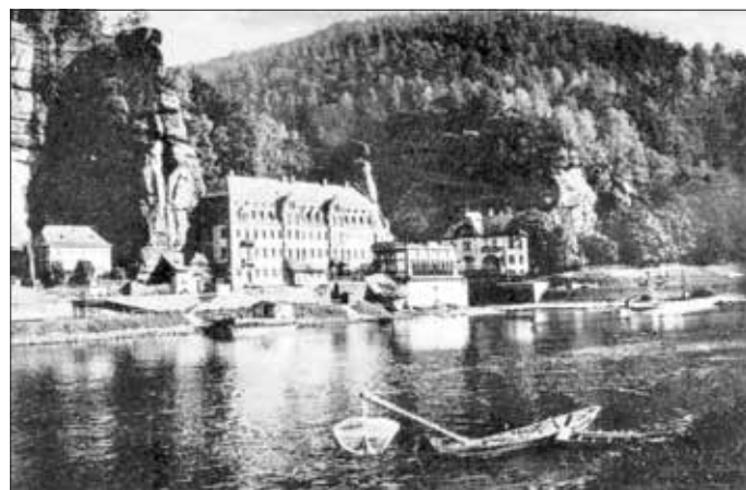
Fischerkahn in der Elbe am Bahnhof Schöna, Ansichtskarte um 1925