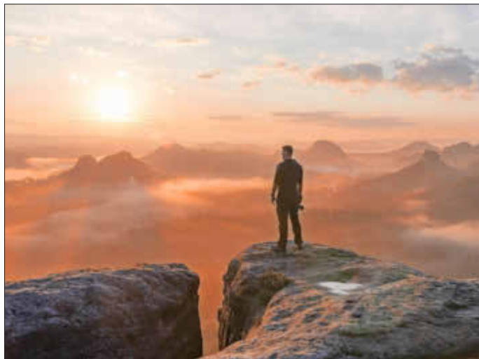
Sonne, Bergpanorama, Nebelmeer: Mit dieser Komposition á la Caspar David Friedrich gehört das Bild „Fotograf genießt am Kleinen Winterberg“ zu den zwölf Gewinnern