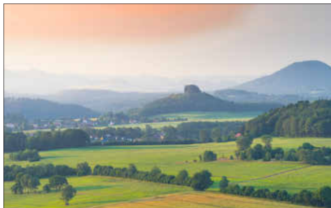
Ausblick vom Wolfsberg zum Zirkelstein

Ihre Stimme hat dazu beigetragen, den Titel in unsere Region zu holen und die Schönheit der Sächsischen Schweiz deutschlandweit bekannt zu machen. Wandeln auf den Spuren des Meisters, innehalten, wo er innegehalten hat und vielleicht sogar zeichnen, wo er gezeichnet hat: Dazu lädt der Caspar-David-Friedrich-Weg ein. Wer selbst auf den Spuren des Malers wandeln möchte, startet bequem in Krippen und erlebt unterwegs die einmalige Verbindung von Kunst und Natur. Jeden Dienstag wird die Tour sogar geführt angeboten – weitere Informationen unter www.bad-schandau.de .