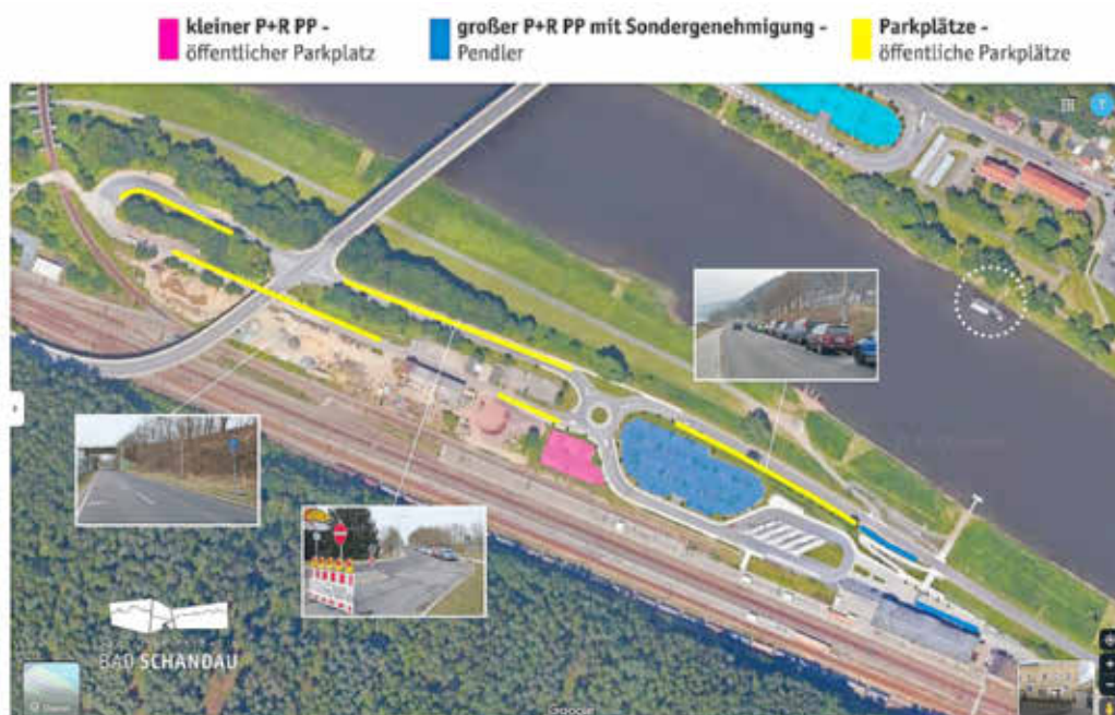
Parkmöglichkeiten linkselbisch am Nationalpark-Bahnhof

Auf der linken Elbseite ist Folgendes vorgesehen: