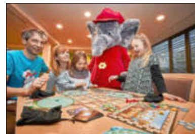
Viele Gäste werden beim Benjamin-Blümchen-Spieletag am 2. März im NationalparkZentrum erwartet.

Den Schließmonat Januar nutzte das Team des NationalparkZentrums für kleinere Reparaturen sowie für die Umgestaltung des Eingangsfoyers. Hier ist nun ein lichter Bereich für die Besucher entstanden. Bald besteht hier und andernorts im NationalparkZentrum die Möglichkeit, Benjamin Blümchen bei zwei Auftritten zu begegnen und neueste Brettspiele auszuprobieren, denn am 2. März lädt der Kinderliebbling zum Spieletag hierher.