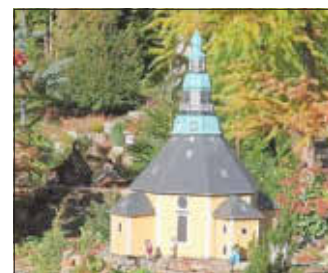
Miniatur-Kirche in Seiffen

Mit über 200 Exponaten zeigt das „Klein-Erzgebirge“ die Architektur und Wirtschaft des Erzgebirges, aber vor allem werden Geschichten aus dem Erzgebirge erzählt. Die Modelle (heute zum großen Teil im Maßstab von 1:25) sind der erzgebirgischen Volkskunst folgend aus Holz gefertigt und mit handgeschnitzten Figuren und Tieren ergänzt, wobei die wasserradgetriebenen Objekte ein besonderer Schatz der Anlage sind. Ein wesentlicher Teil des Klein-Erzgebirge ist der Park, mit einer Landschaftsgestaltung wie im richtigen Leben. Die Ausstellung umfasst zudem zahlreiche Modellbahnen.