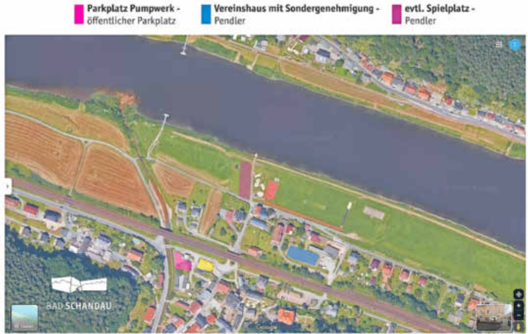
Parkmöglichkeiten in Krippen

Für die Parkgenehmigung wird eine einmalige Verwaltungsgebühr in Höhe von 20 € erhoben.